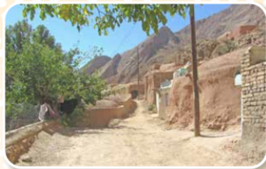
قبل از اجرای طرح هادی