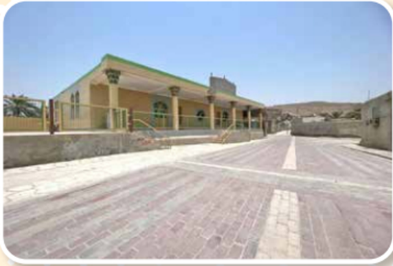
روستای قلاتو بخش مرکزی شهرستان بندرعباس