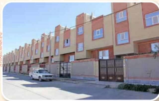
پروژه علی آباد لوله شهرستان بیرجند