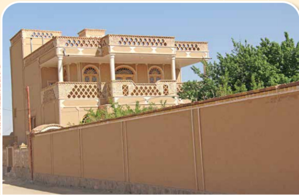
روستای باغستان علیا شهرستان فردوس